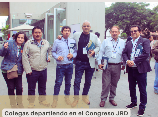
Colegas departiendo en el Congreso JRD