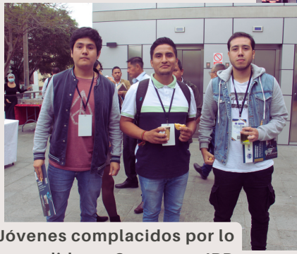
Jóvenes complacidos por lo aprendido en Congreso JRD