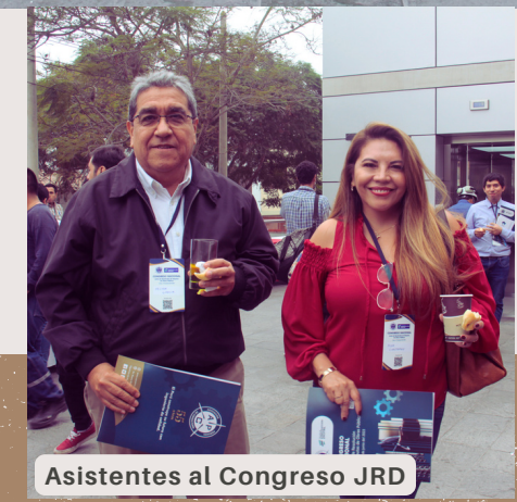
Asistentes al Congreso JRD