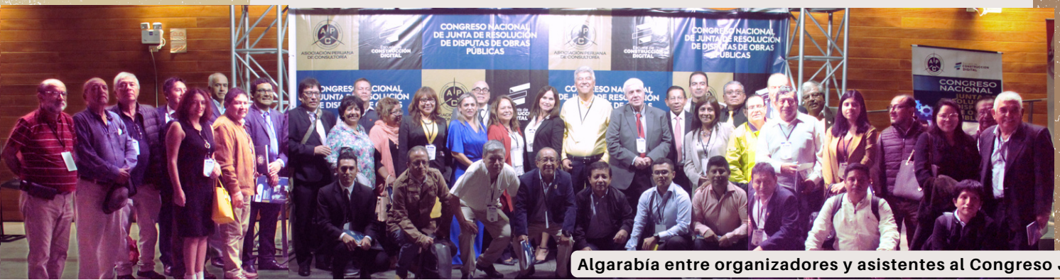
Algarabía entre organizadores y asistentes al Congreso JRD