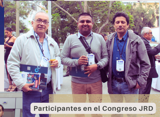
Participantes en el Congreso JRD